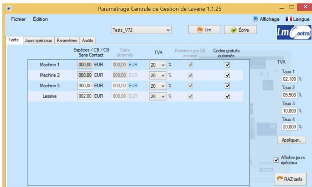
Figure 4 : Paramétrage des tarifs « normaux ».

La suite de votre paramétrage reste inchangée.