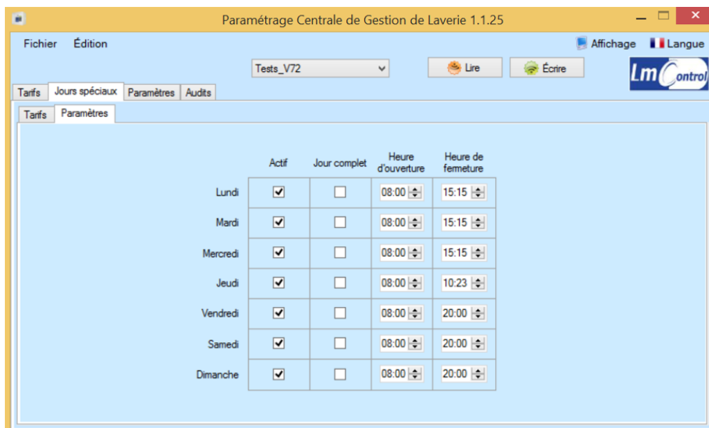
Figure 3 : Paramétrage des jours et plages horaire de fonctionnement des sélections inopérantes à instant t donné.

Après avoir paramétré le comportement des sélections inopérantes à un instant t donné, il est impératif de revenir dans l'onglet « Tarifs » (Figure 4) :